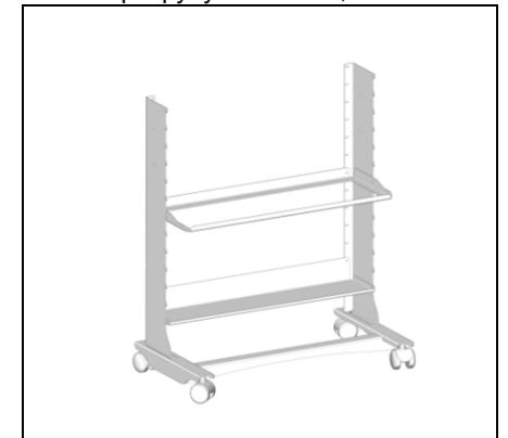
Мал.4 Кріпимо полиці гвинтом М4х8.