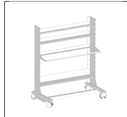
Мал.5 Декоративна гайка зовні