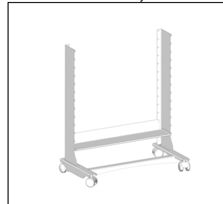
Мал.3 Полиці ставимо, починаючи з нижньої