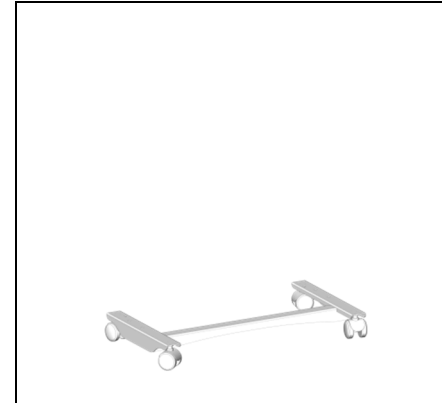
Мал.1 Починаємо з низу

Стіл збирає одна людина, з самого початку не затягуючи кріплення, згідно наведених нижче малюнків.