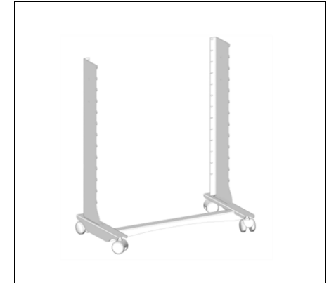
Мал.2 Прикручуємо стійки, гвинти М5.